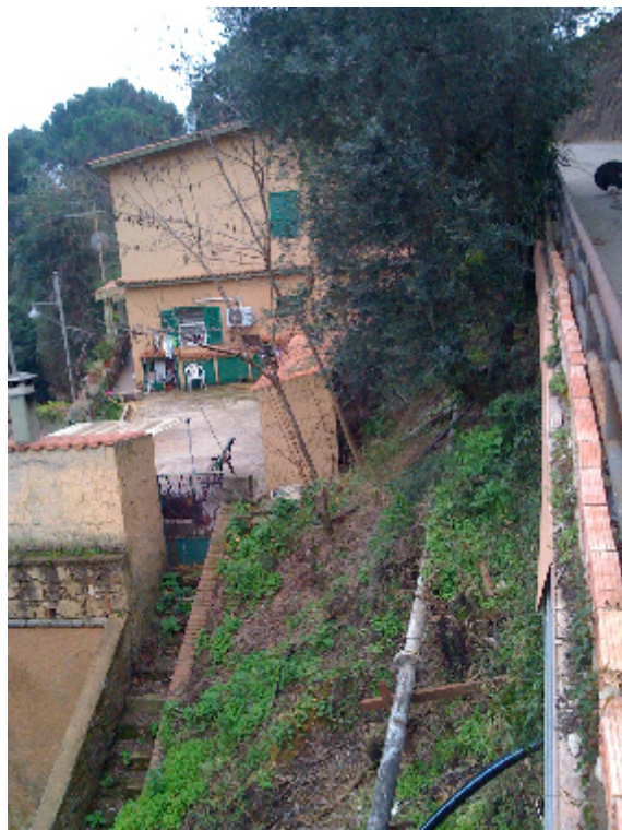
VERSANTE S-E TERRAZZAMENTO