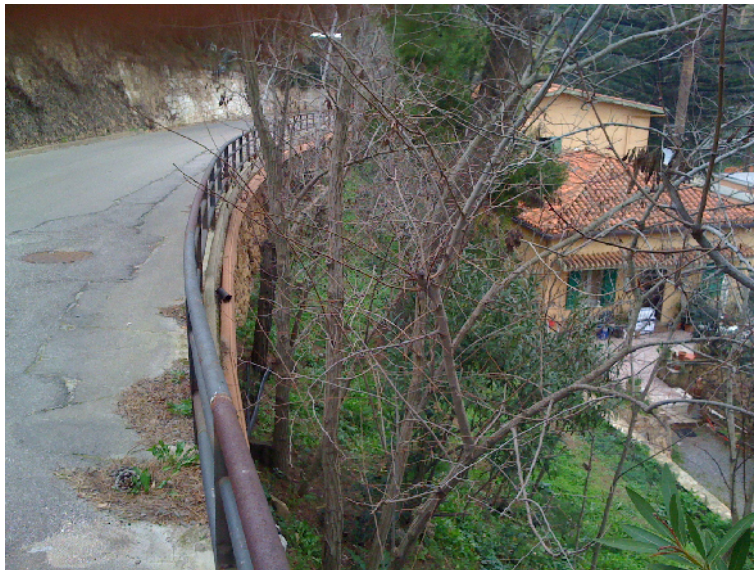
VERSANTE S-E TERRAZZAMENTO