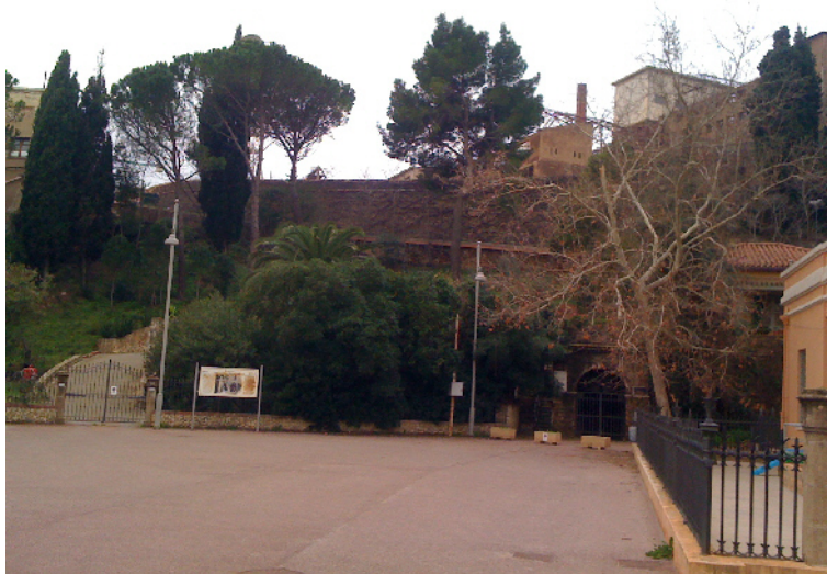
VISTA DALLA PIAZZA DELLA CHIESA DI MONTEPONI